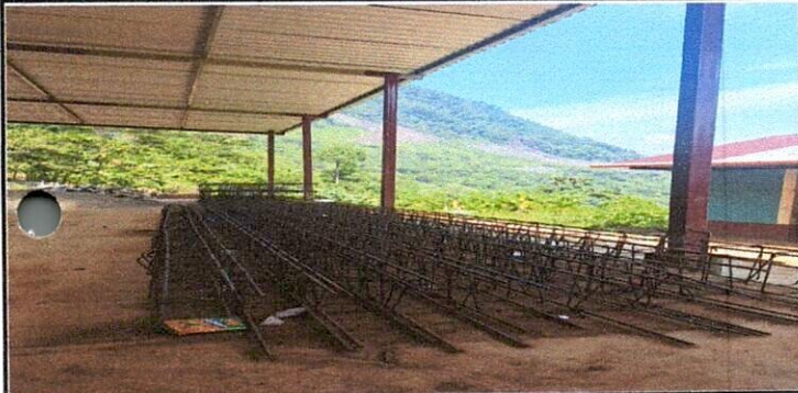
Foto1: ARMADURAS PARA COLUMNAS DE MURO DE CONTENCIÓN